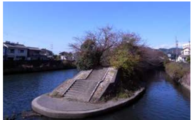
巴川・山原川合流付近

http://www.shizuoka-kasen-navi.jp/html/tomoe/leisure_03.html