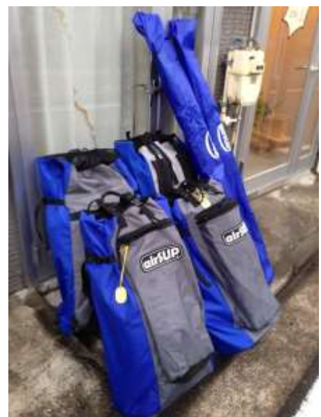
空気を抜いて保管