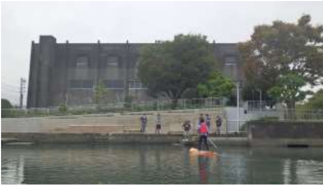
隣接する浜田ポンプ場