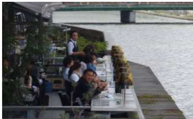
水辺オープンカフェ

http://www.hamanotoudai.com/archive?cat=3