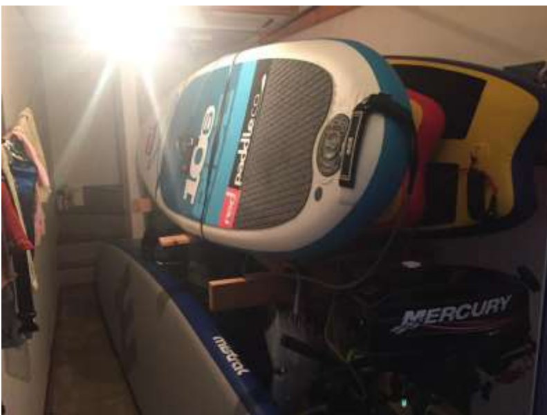
インフレーター SUP を膨らましたまま保管