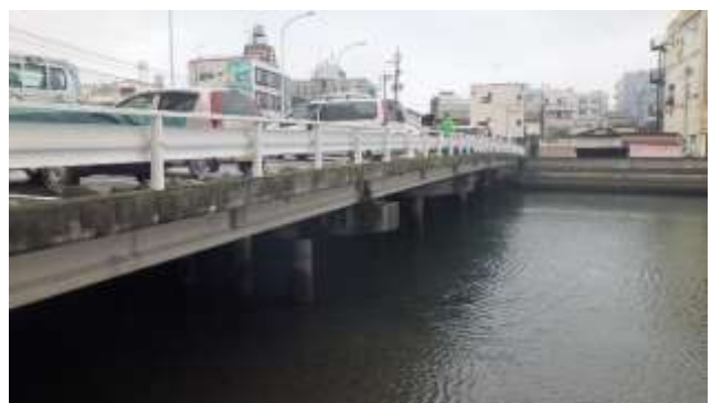
清水千歳橋駐車場