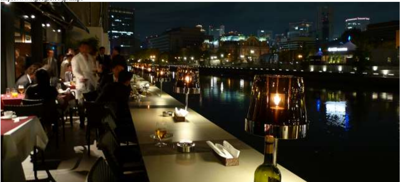
水辺飲食店イメージ